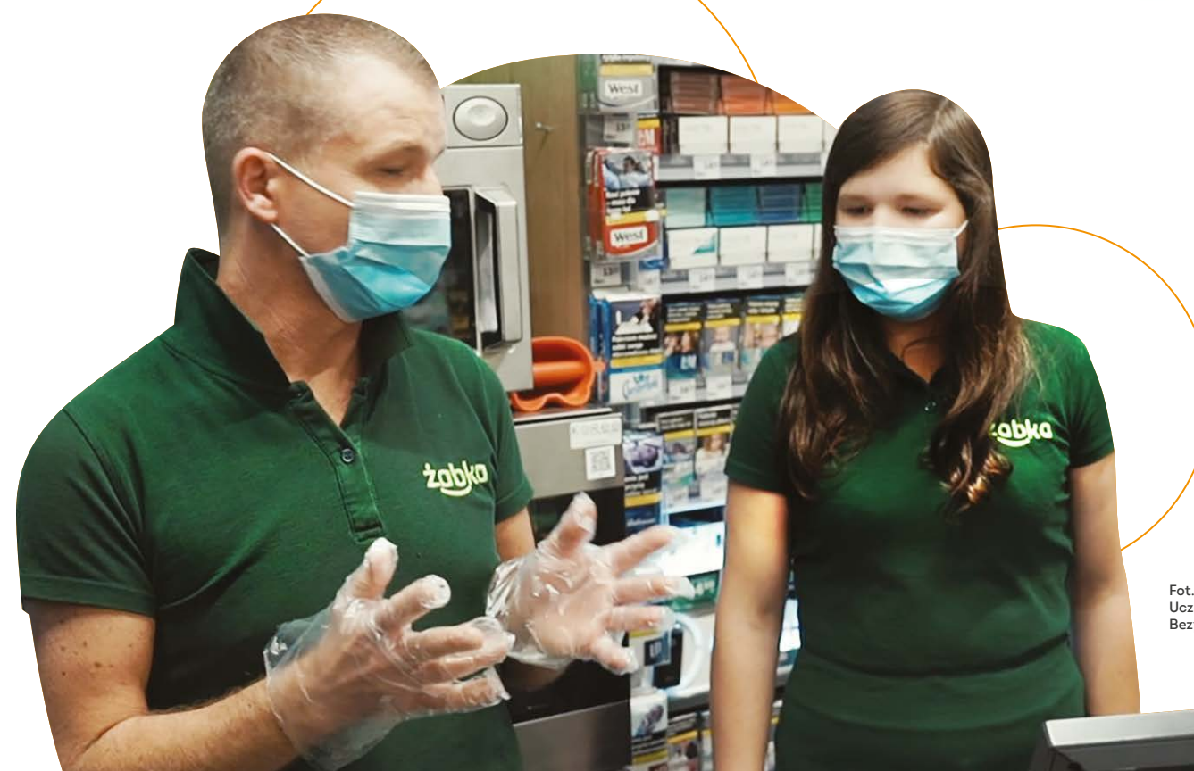
Fot. Uczestnik programu Bezpieczny Staż z Żabką